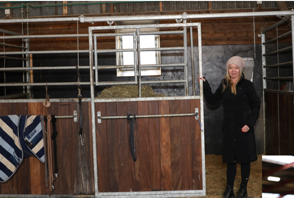
Fire G.U.L. har sin boks i den ombyggede lade.